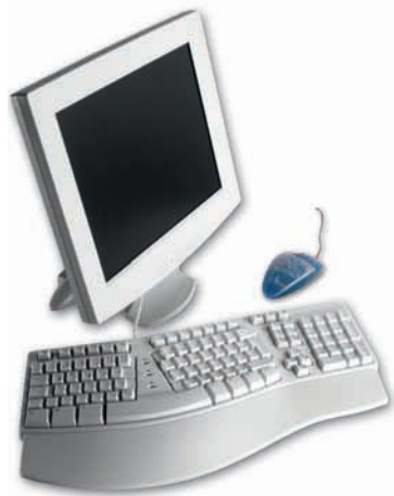
Bildschirm, Maus, Tastatur