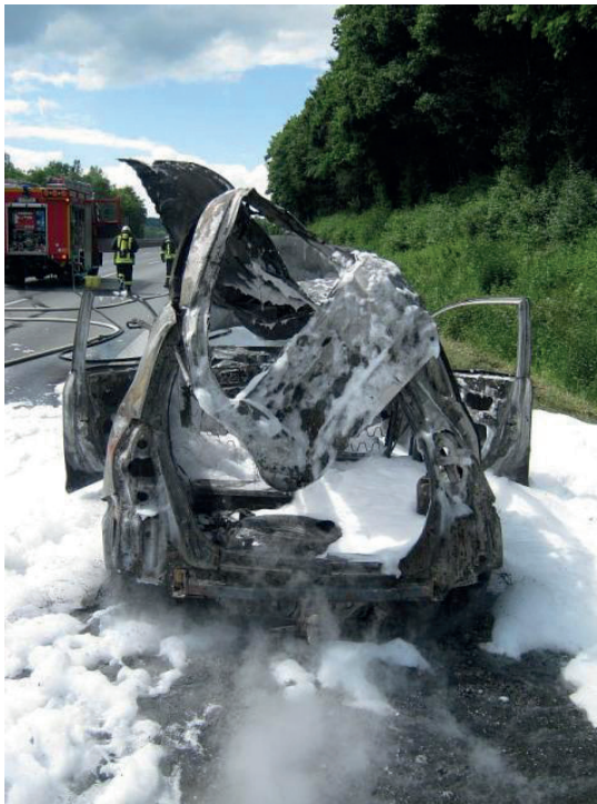
Abb. 15: Abgerissenes Fahrzeugdach nach Gastank-Explosion.