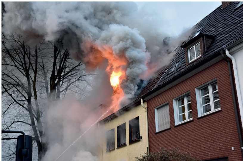
Abb. 18: Brand in einem Reihenhendhaus.

Mit der immer weiter voranschreitenden Technologie in der Automobilbranche ist dies nicht anders. Da die Vielfalt an Fahrzeugmodellen, neuen Technologien sowie das stetige Wachstum an neuen Fahrzeugen das Wissen aus dem Gedächtnis nicht mehr möglich macht, wurden schließlich die Rettungskarten eingeführt. Der Einsatzleiter hat, wie bei den Einsatzplänen und Laufkarten, die Möglichkeit der schnellen Informationsgewinnung.