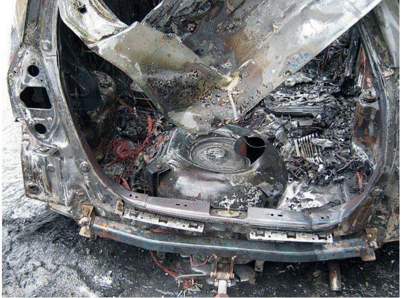
Abb. 16: Aufgerissener LPG-Tank nach Brandeinwirkung.