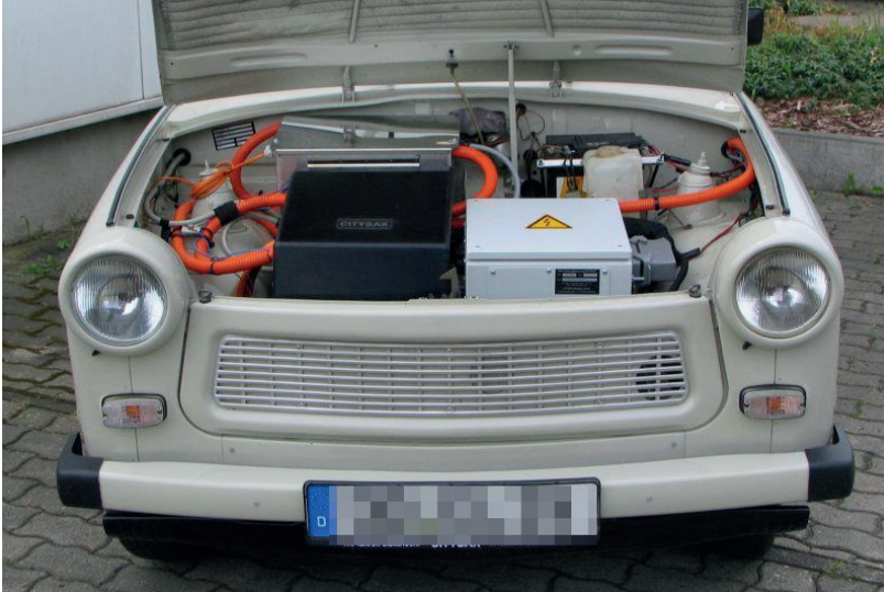
Abb. 19: Ungerüsteter Trabant auf Elektroantrieb.