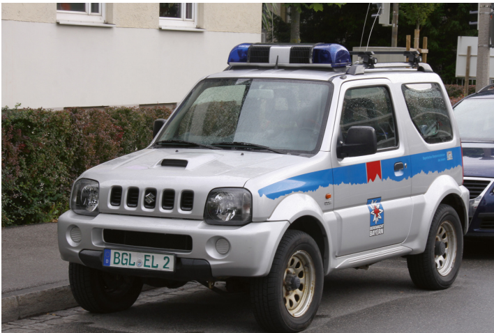
Abb. 62 Grünes Kennzeichen an einem Einsatzfahrzeug der Bayerischen Bergwacht