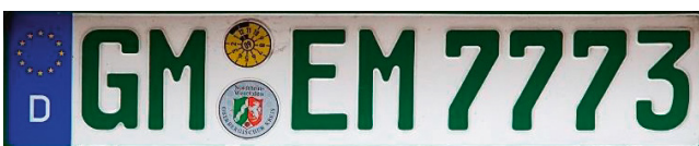
Abb. 61 Grünes Kennzeichen