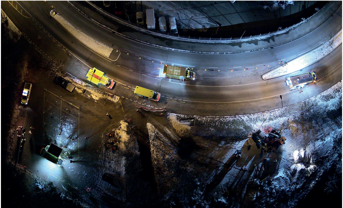
Abb. 46: Beispiel eines gut gewählten Start- und Landeplatzes (rot beleuchtet) in der Nähe der Ladeinfrastruktur im Drohnenfahrzeug (unten links)

hende Fahrer dies übernimmt. Vor dem Aufstieg könnte die Hilfsperson den Start- und Landeplatz vorbereiten, Beleuchtung aufbauen und die Drohne gemäß einer Checkliste in Betrieb nehmen, während der Drohnenpilot mit der Einsatzleitung die Mission im Detail bespricht. Die Hilfsperson könnte auch bei der Auswertung von Sensordaten wie Fotos oder Videos helfen oder zusätzliche Nutzlast bedienen.