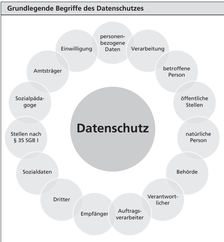
Abbildung 1: Grundlegende Begriffe des Datenschutzes

Im Einzelnen begleiten, bestimmen und begrenzen insbesondere folgende Begriffe den Datenschutz: