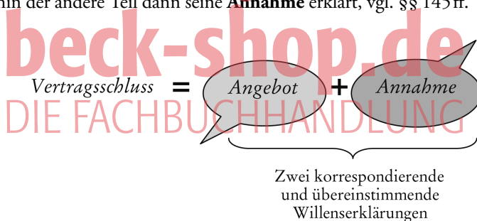
Abbildung 23: Vertragsschluss