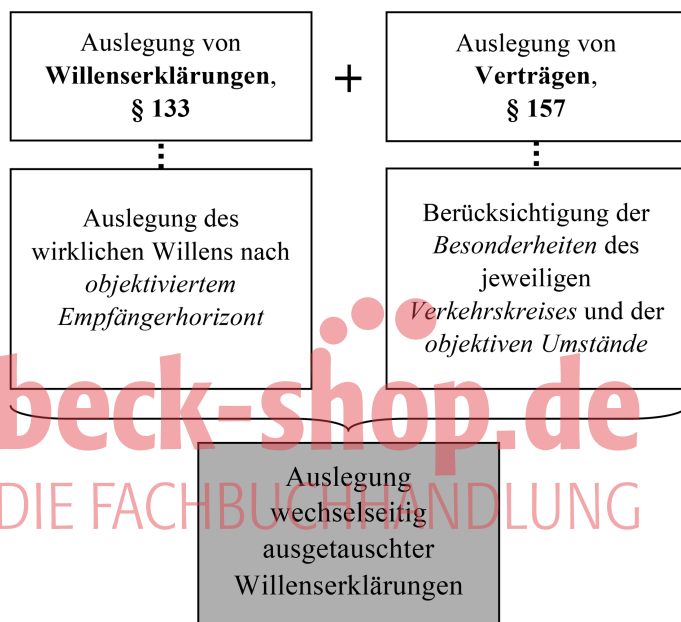
Abbildung 24: Auslegungsregeln

Behauptete gar nicht versprochen zu haben (im Handelsrecht gibt es daher auch die gewohnheitsrechtliche Figur des „kaufmännischen Bestätigungsschreibens“, vgl. § 6 II 3, Rn. 18). Juristen sind dann gefragt, wenn beide Seiten von einem unterschiedlichen Vertragsinhalt ausgehen. Führt diese Differenzen gleich zur Nichtigkeit des Vertrags, wäre der Vertrag kein sehr taugliches Instrument zur Rechtsgestaltung. Jede mit dem Vertragsschluss später unzufriedene Seite würde dann einfach behaupten, etwas ganz anderes gewollt zu haben. Es muss also eine Möglichkeit geben, den für die „rechtliche Beurteilung maßgeblichen Inhalt einer Willenserklärung“ festzustellen (näher juris-PK-BGB/Reichold BGB § 133 Rn. 7ff.). Dies geschieht durch die Auslegung von rechtsgeschäftlichen Erklärungen nach §§ 133, 157.