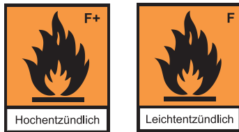
Bild 5: Kennzeichnung brennbarer Flüssigkeiten nach der Gefahrstoffverordnung (GefStoffV)

Die GHS-Verordnung (Globally Harmonised System of Classification and Labelling of Chemicals) klassifiziert noch etwas genauer, was aber für den Feuerwehreinsatz keinen Unterschied macht.