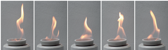
Bild 4: Brennbare Flüssigkeiten verbrennen normalerweise nur unter Flammerscheinung, bei unvollständigen Verbrennungen tritt auch eine Rußbildung auf.

beim Löschen von brennbaren Flüssigkeiten eine wichtige Rolle spielt (siehe Kapitel 8 »Löschmittel«). Je nachdem, um welche Flüssigkeit es sich handelt, entwickeln sich abhängig von Umgebungstemperatur und Umgebungsdruck mehr oder weniger zündfähige Dämpfe. Ein typisches Merkmal für Stoffe der Brandklasse B ist, dass sie nur unter Flammerscheinung brennen. Je nach Unvollständigkeit der Verbrennung ist aber auch hier eine Rußbildung die Regel, vor allem wenn es sich um größere (längere) Kohlenwasserstoffverbindungen handelt. Die komplexen Kohlenwasserstoffverbindungen Benzin oder Diesel verbrennen mit einer deutlichen Ruß- und Rauchentwicklung, ebenso Wachs. Brennspritus bzw. Ethanol oder Methanol hingegen rauchen fast überhaupt nicht.