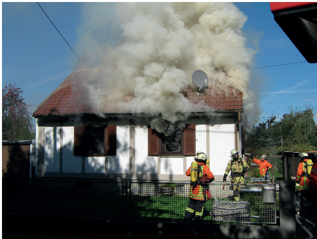
Bild 3: Der Rauchaustritt bei einem Schadfeuer lässt Rückschlüsse auf das Brandgeschehen zu.

der Explosion sind im Kapitel 5 »Voraussetzung Mengenverhältnis« näher erläutert.