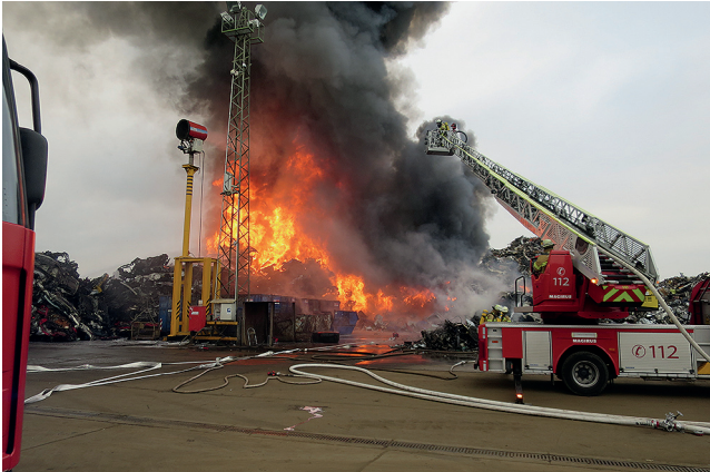
Bild 2: Feste brennbare Stoffe verbrennen mit Flammeercheinung und Glutbildung sowie Rußbildung

Eine besondere Gefahr geht von brennbaren festen Stoffen aus, die in feinstverteilter Form vorliegen, den Stäuben. Zu nennen sind hier die klassischen organischen Stäube aus Holz oder Kohle sowie den daraus abgeleiteten Nahrungsmittelstäuben aus Mehl und Zucker. Es sind aber auch Stäube von Schwefel, Hartgummi, Erzen, Kunststoffen, Arzneimitteln oder Farbstoffen anzuführen. In der Luft bilden diese Stäube explosionsfähige Atmosphären, die sich ähnlich wie Dampf- oder Gas-Luft-Gemische verhalten und unterschiedliche Abbrandverhalten aufweisen. Die für die Feuerwehr relevanten Kennzahlen bzw. Begrifflichkeiten im großen Umfeld des Begriffs