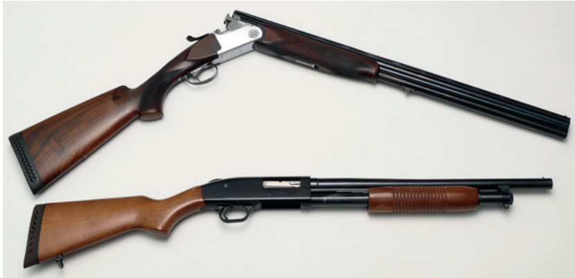
Abbildung 3: von oben: 1) Bockflinte mit geöffnetem Verschluss, Fabrikat Rottweil, Kaliber 12/70. 2) Vorderschaft-Repetierflinte (Pumpflinte), Fabrikat Mossberg, Kaliber 12/76.

aufgebockt – daher die Namensgebung. Man spricht von Bockwaffen, wenn die Läufe übereinander angeordnet sind, also auch bei Büchsen oder kombinierten Jagdwaffen mit Büchsen- und Schrotläufen. Die Namensgebung hat also mit dem Schuss auf den Rehbock nichts zu tun! Bei Flinten, deren Läufe nebeneinander angeordnet sind, spricht man von Querflinten oder Doppelflinten .