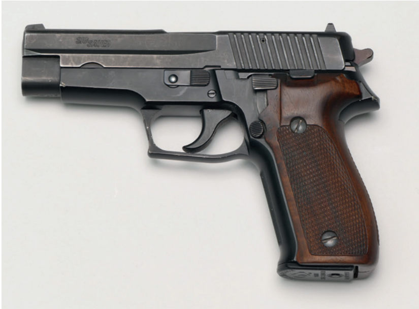
Abbildung 9: Selbstladepistole SIG-Sauer, Modell 226, Kaliber 9 mm Luger – eine der zuverlässigsten Selbstladepistolen. Die Waffe hat deutliche Gebrauchsspuren vom Schießen und Führen – mit dieser Waffe wurden auch mehrere tausend Schuss abgegeben, ohne jegliche Störung.