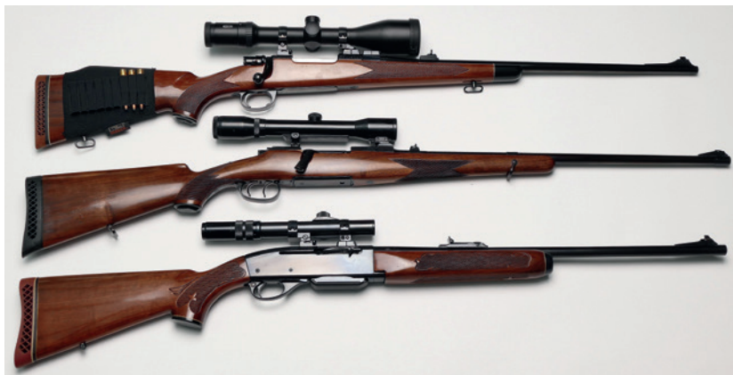
Abbildung 1: Jagdgewehre von oben: 1) Repetierbüchse, System Mauser 98, Kal. .308 Win., Repetiergewehr. 2) Repetierbüchse, System Mannlicher-Schönauer Mod. GK, Kal. 7 x 64. 3) Selbstladebüchse, Gasdrucklader Mod. Remington 742, Kal. .308 Win.