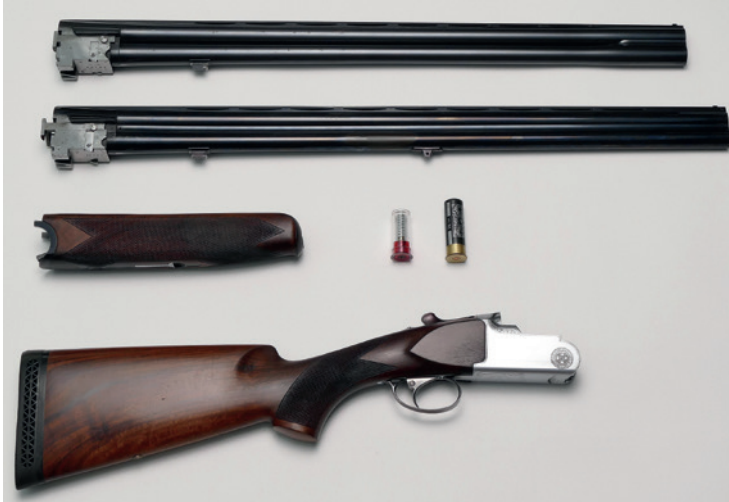
Abbildung 6: Jagdlich und sportlich genutzte Bockflinte (mit Skeet-Austauschlauf) in für Transport und Reinigung zerlegtem Zustand. Deutliche Gebrauchsspuren sind erkennbar – mit der Flinte wurden aber auch mehrere tausend Schuss abgegeben! Der Verschluss selbst zeigt keinerlei Verschleißerscheinungen und schließt noch vollkommen „dicht“. Über dem sogenannten Hinterschaft mit Verschluss und Abzugseinrichtung liegt der sogenannte Vorderschaft, rechts daneben eine Pufferpatrone, die dem schonenden „Abschlagen“ dient, und eine Jagdpatrone.