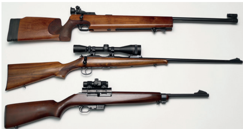
Abbildung 2: Kleinkalibergewehre (alle Kaliber .22 long rifle oder .22 lfb): von oben: 1) Wettkampfbüchse, Fa. Walther für sportliches Schießen auf 50 m (Einzellader) mit sogenannter Diopter-Visierung. 2) Jagdbüchse für Kleinwild, Brünner Waffenwerke, Mod. 2 (Mehrlader) mit Zielfernrohr. 3) Selbstladebüchse, Erma EGMI, Mod. 70 mit Rotpunktvisier.