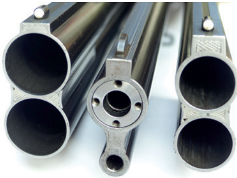
Abbildung 4: Mündungen einer Bockflinte (rechts und links – deutlich erkennbar – die glatten Läufe Kaliber 12; der linke Lauf hat eine sogenannte Skeet-Bohrung für kurze Schussentfernungen, der rechte Lauf hat Choke-Bohrungen \frac{1}{2} und 1/1 für jagdliche Entfernungen). Bei dem mittleren Lauf handelt es sich um die Mündungsansicht einer sogenannten Bockbüchsenflinte im Kal. 16/70 und .222 Rem. mit der Besonderheit, dass in den Schrotlauf ein mündungslanger Einstecklauf im Kal. .30–30 Win. eingelegt ist. Dieser kann an der Mündung mit vier Schrauben eingestellt werden, sodass er mit dem unteren Kugellauf „zusammenschießt“.