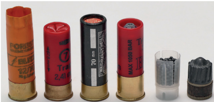
Abbildung 7: Schrotpatronen – v.l.n.r.: abgeschossene Patrone (erkennbar die offene Börde-lung). Patronen mit der Angabe der Hülsenlänge 67,5 mm und 70 mm. Patrone mit Flinten-laufgeschoss und max. Gasdruckangabe. Schrote mit Schrotbeutel aus Plastik (damit wird eine Berührung der Schrote mit dem Lauf vermieden, somit keine Verformung der Schrote, bessere Abdichtung im Lauf und auch gleichmäßigere Streuung der Schrote). Flintenlaufgeschoss Kal. 12 (Fabrikat Brenneke).